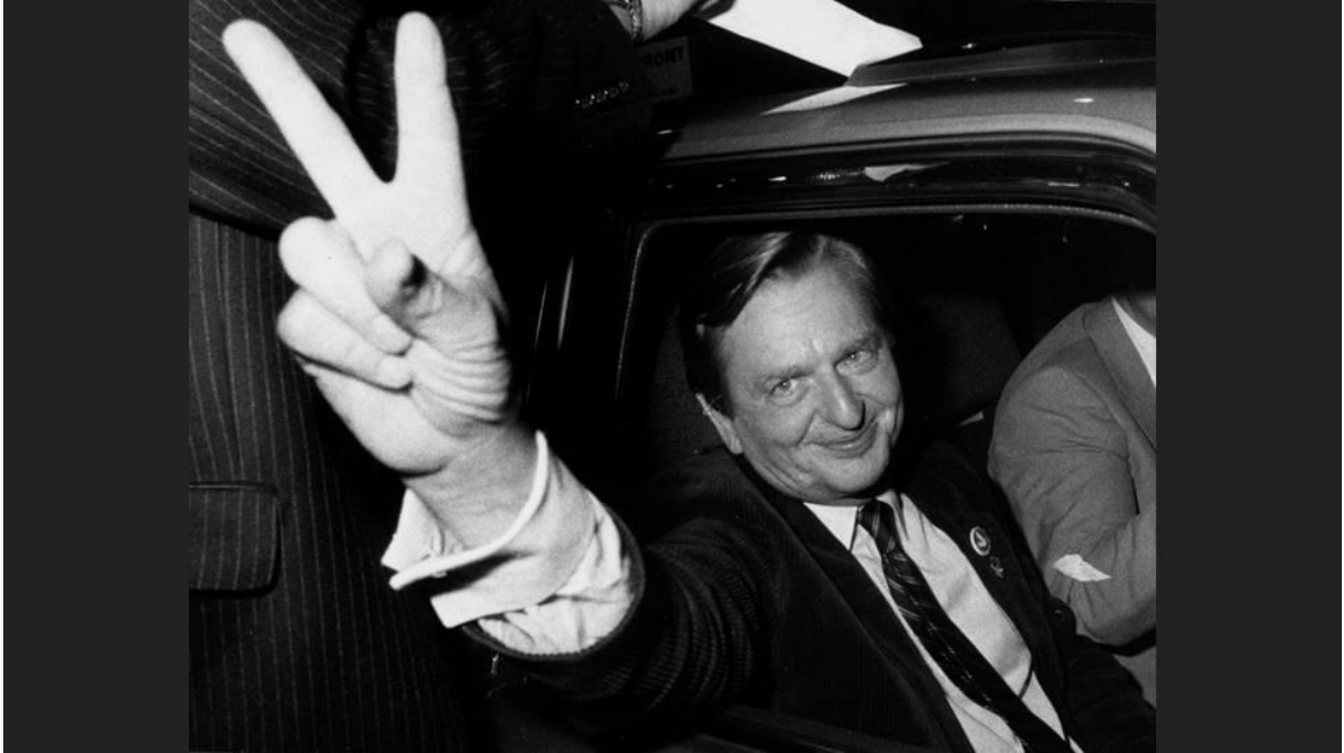
Partiordförande 1969–1986 Olof Palme