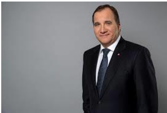
Partiordförande 2012-Stefan Löfven