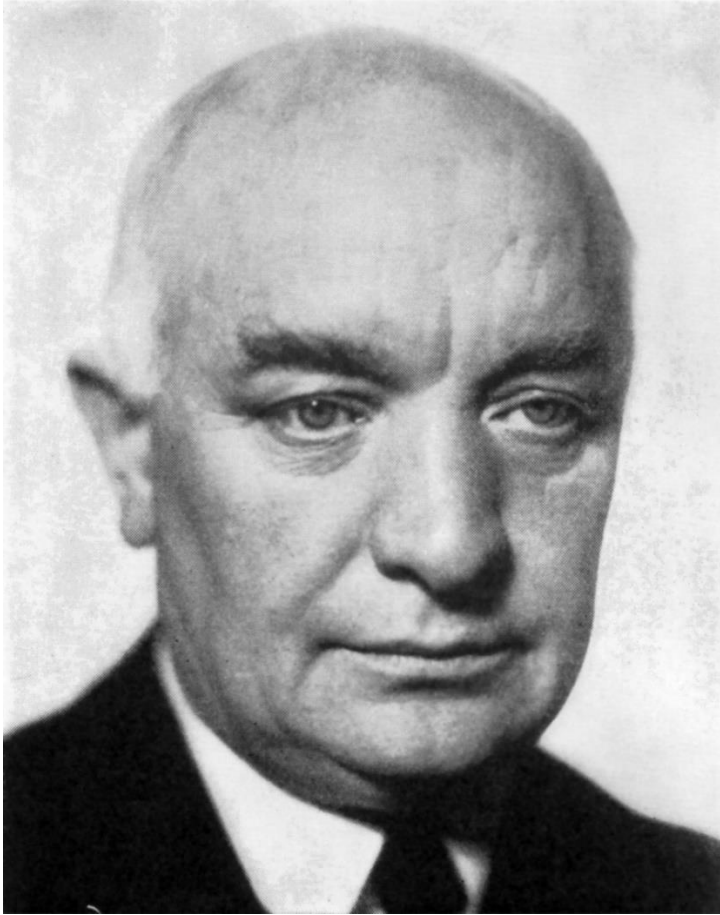
Partiordförande 1925–1946 Per-Albin Hansson