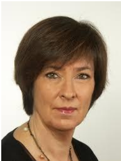
Partiordförande 2007–2011 Mona Sahlin