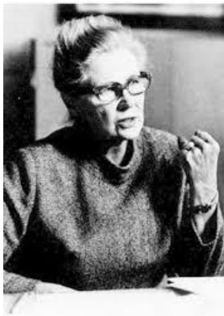
ALVA MYRDAL