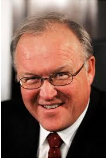
Partiordförande 1996–2007 Göran Persson