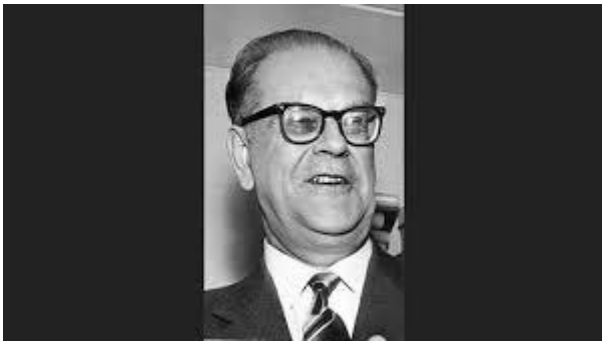
Partiordförande 1946–1969 Tage Erlander