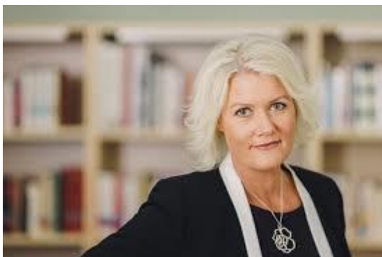
Partisekreterare Lena Rådström Baastad 2016 -