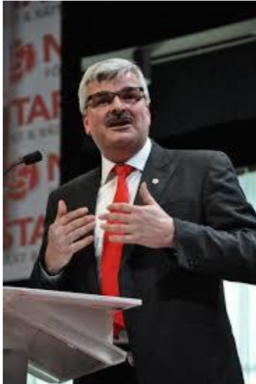
Partiordförande 2011–2012 Håkan Juholt